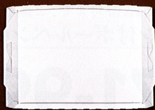
分割トレイ配膳車対応